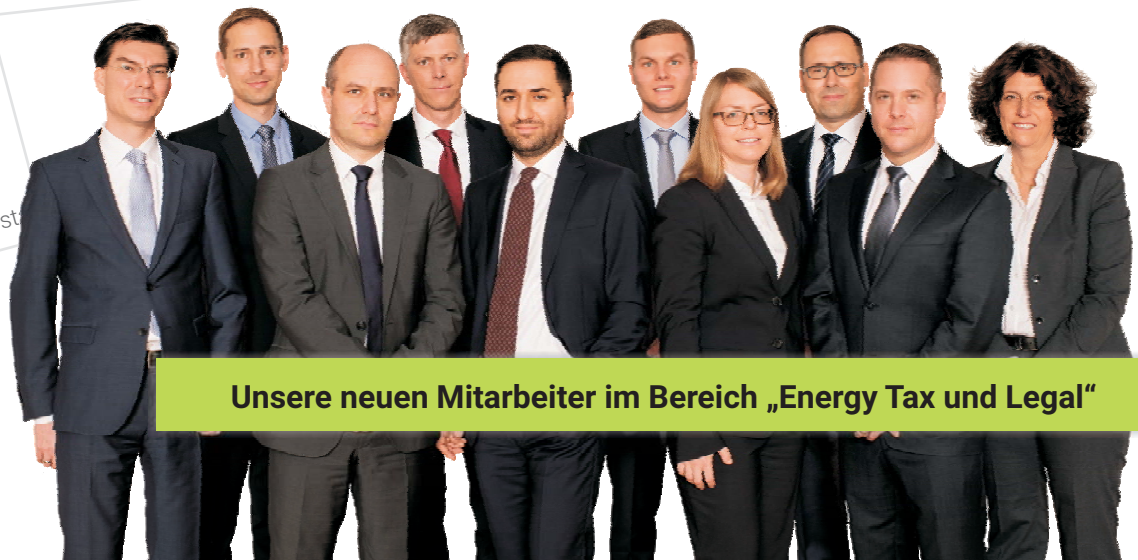
Unsere neuen Mitarbeiter im Bereich „Energy Tax und Legal“